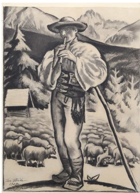
1B/ J. Hála: Tatranský pastier, 1927/ stav po reštaurovaní