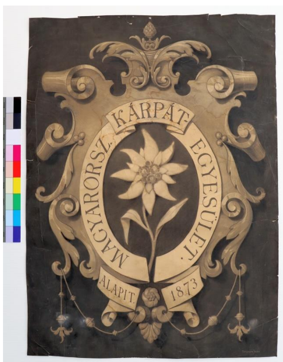
3A/ V. Forberger: Znak Uhorského Karpatského spolku / stav pred reštaurovaním