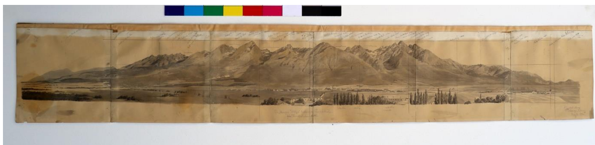
2A/ V. Forberger: Vysoké a Belianske Tatry od Popradu, 1884/ stav pred reštaurovaním