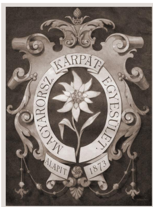
3B/ V. Forberger: Znak Uhorského Karpatského spolku / stav po reštaurovaní