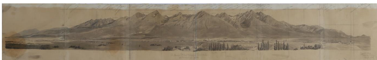
2B/ V. Forberger: Vysoké a Belianske Tatry od Popradu, 1884/ stav po reštaurovaní