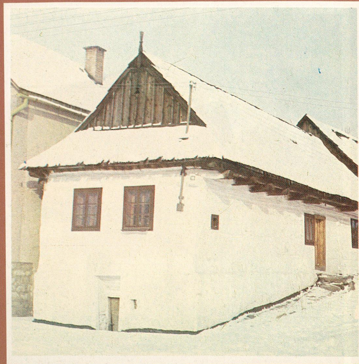
Zadná časť poľnohospodárskej usadlosti v Osturni ► Obytný dom s pivnicou v podmurovke v Štrbe ►►