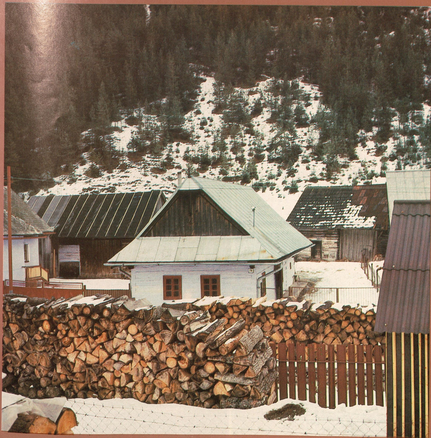
Obytný dom vo Vernári