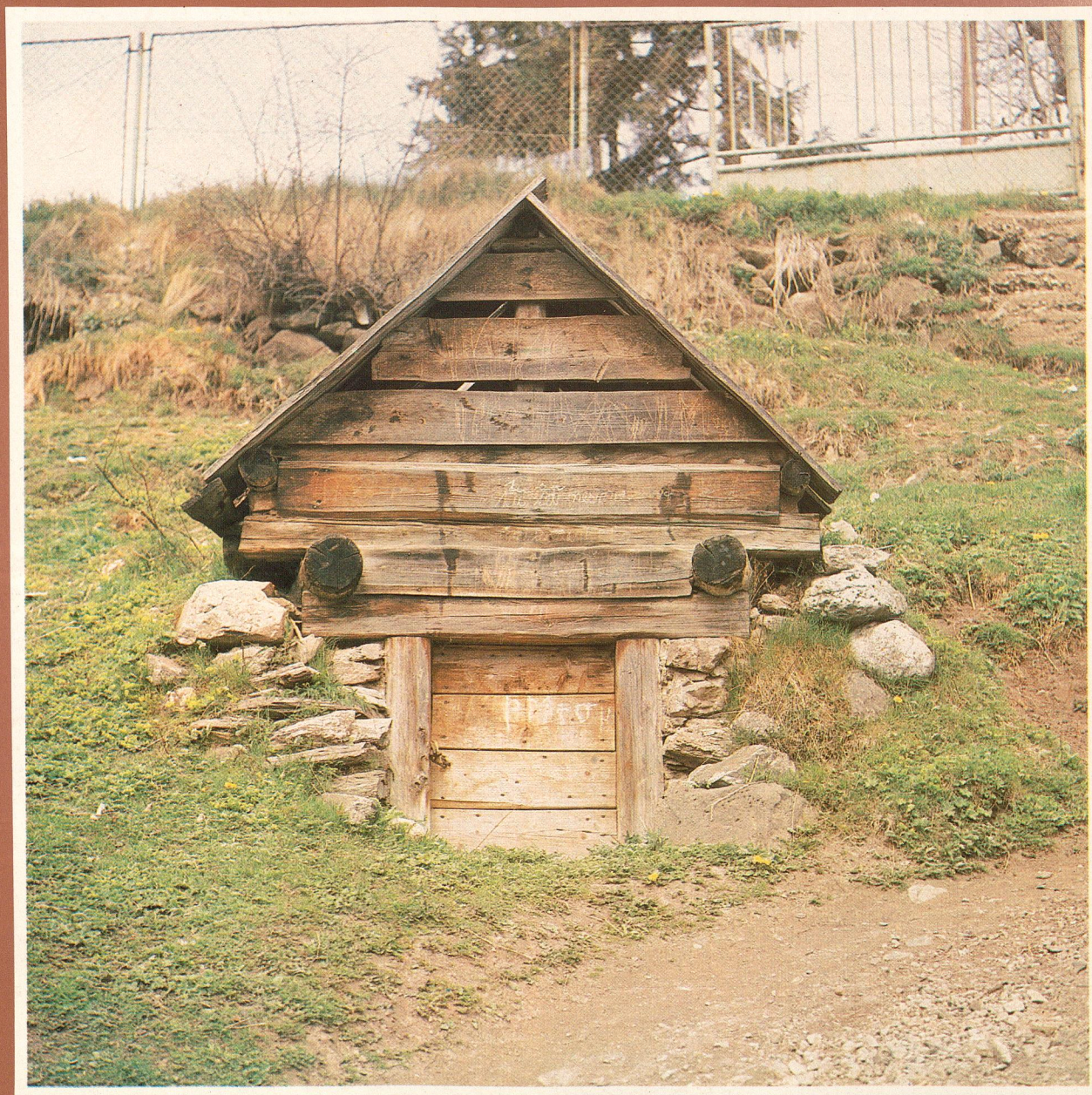
Pivnica na zemiaky - Liptovská Teplička