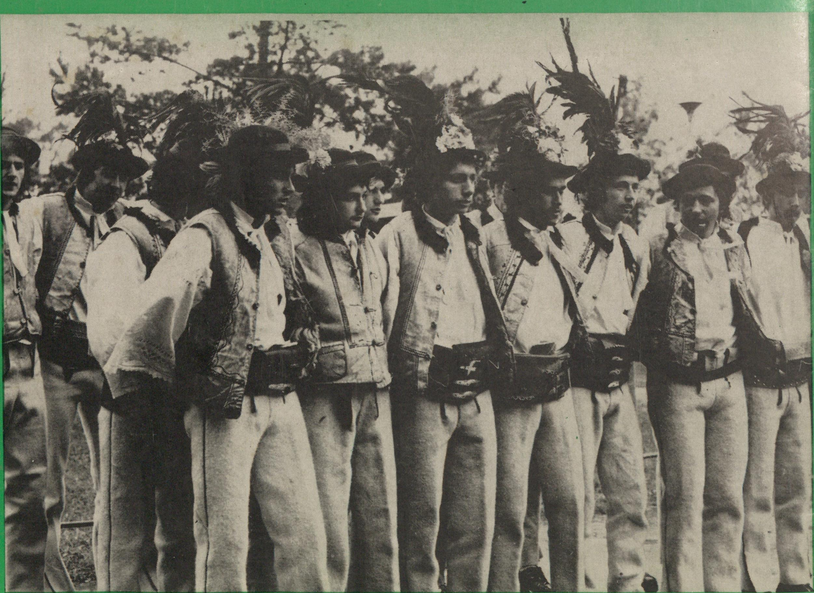
▲ Regrúti zo Štrby