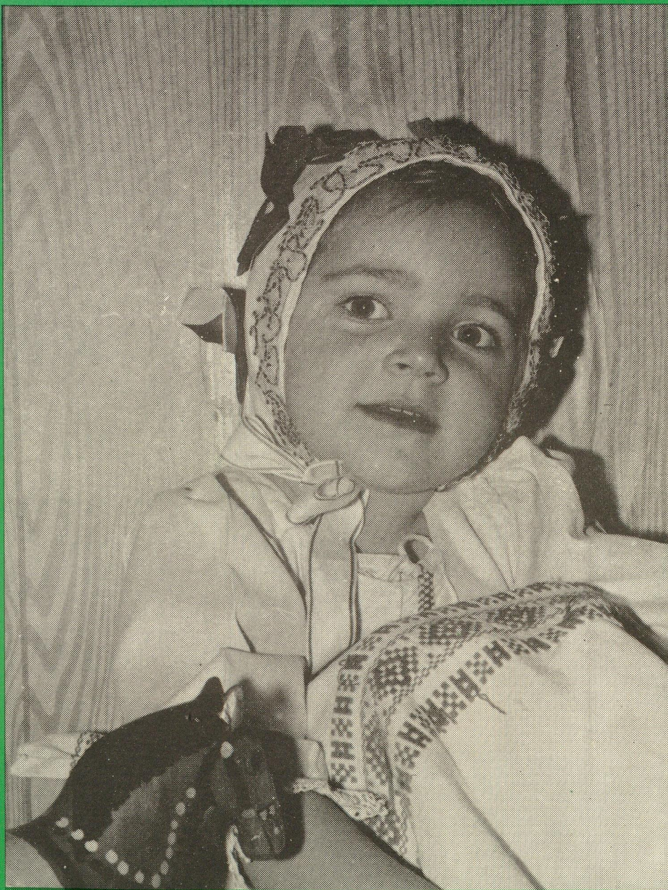
Dievčatko s koníkom

Prvým oblečením dieťaťa bola plienka, do ktorej dieťa zavinuli a uložili do perinky, ktorú silno okrutili povojníkom. Prvú košieľku dostalo dieťaťko keď sa už začalo pohybovať, samo sadat'. Oblečenie pre deti sa šilo zo starších, obnosených súčiastok odevu dospeľých. Pre obdobie od jeden a pol roka až do troch rokov je charakteristický odev košeľovitého typu, a to tak pre dievčatká, ako aj pre chlapcov. Vo veku 3 až 6 rokov sa tento odev dopĺňal niektorými súčasťami vrchného odevu. Chlapci