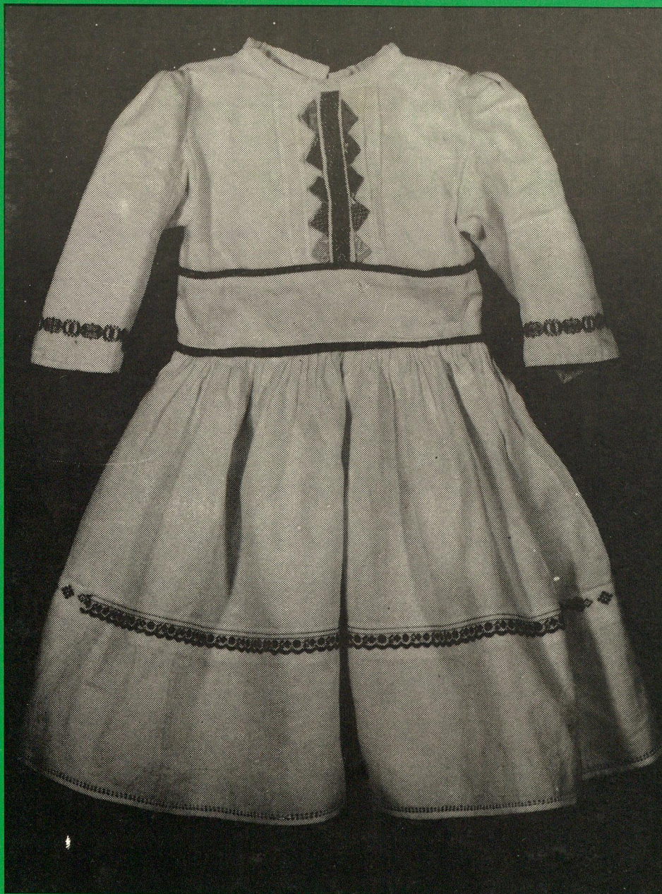
Dievčenské šatôčky. - PM Poprad, inv. č. 2098