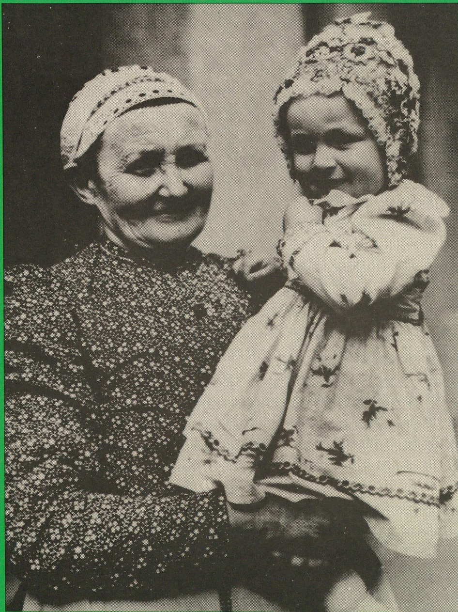
Žena s dieťaťom