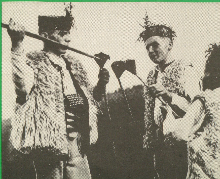
Ždiar, chlapci so sobotkami pred svätajánskym večerom