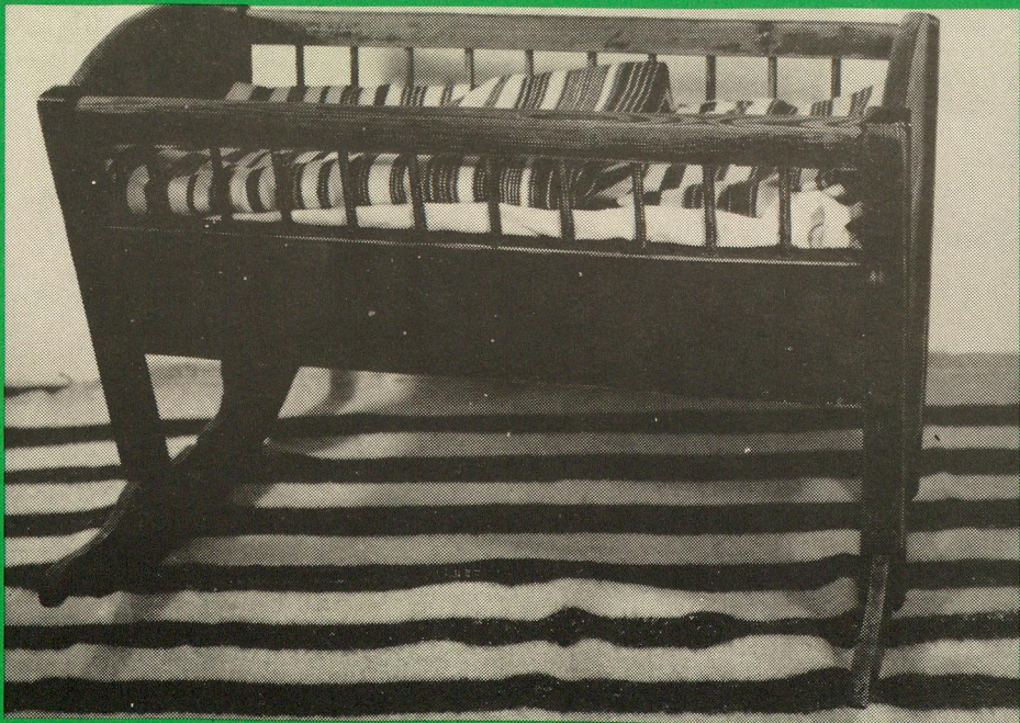
Kolíska podnožová, Múzeum TANAP-u Tatranská Lomnica