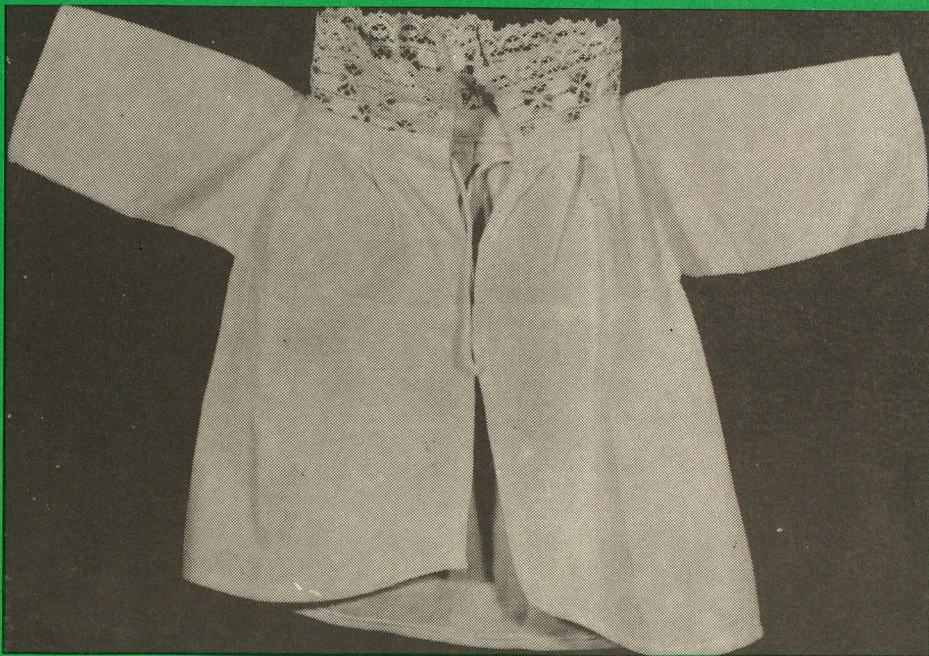
Kojenecká košielka. - PM Poprad, inv. č. 6069