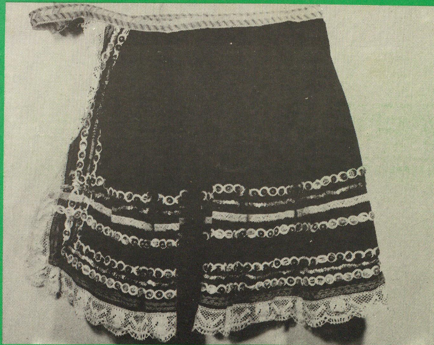
Zástera dievčenecká, - PM Poprad, inv. č. 1304