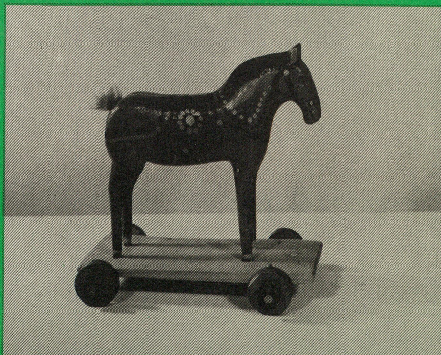
Koník na kolieskach, - PM Poprad, inv. č. 7/88