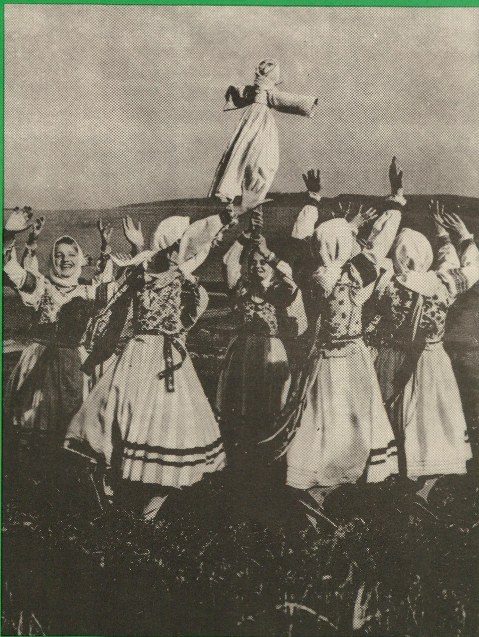
Morena dievčiat z Vrbova